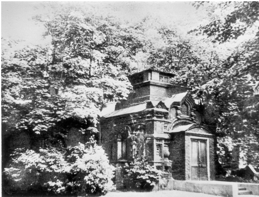
Прозектура ГКБ № 33 им. А. А. Остроумова в реконструированном помещении бывшей погребальной часовни до 1975 г. (фотография 1961 г.).