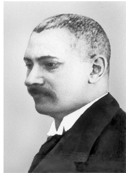
Первый заведующий прозектурой Бахрушинской больницы — проф. Г. В. Власов (1867—1918).

Прозектура осуществляла как аутопсийные, так и биопсийные исследования. Количество вскрытий составило в 1898 г. 111, в дальнейшем, с 1899 по 1917 г., колебалось от 92—95 (в 1910 и 1917 гг.) до 180 (в 1912 и 1916 гг.) в год, что составляло не более 30% от числа умерших в больнице. Патоло-