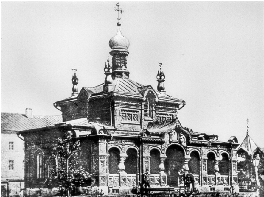
Погребальная часовня Бахрушинской больницы — первое помещение прозектуры (фотография 1901 г.).