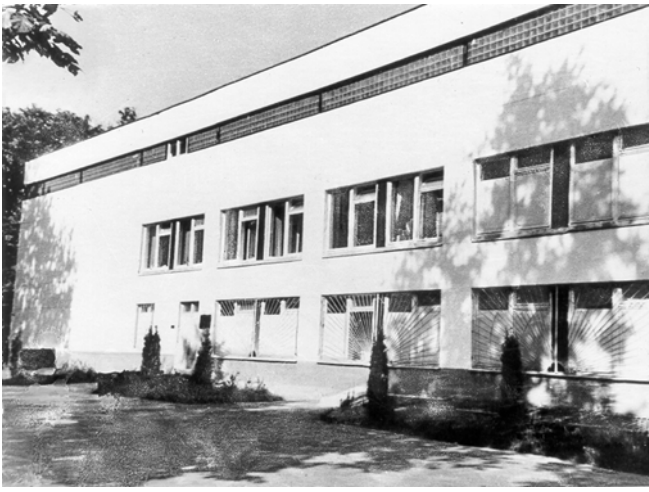
МГЦПИ при ГKB № 33 им. А. А. Остроумова в наши дни (корпус построен в 1975 г.).