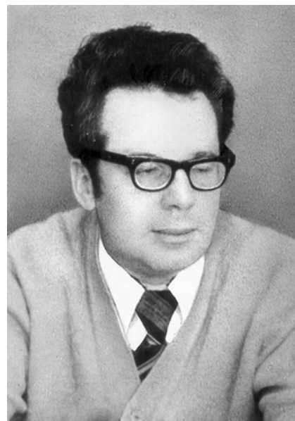
Организатор и первый руководитель МГЦПИ, главный патологоанатом Москвы с 1983 по 1988 г. канд. мед. наук Б. А. Кронрод (1929—1988).

Реорганизация работы отделения проходила в период дальнейшего развития больницы. В 80-е годы число коек достигло 800, дальнейшее развитие получили онкологические отделения — опухоли головы и шеи, общей онкологии, маммологии, радиологии [1, 7]. Количество патологоанатомических вскрытий в конце 70-х и в 80-е годы составляло от 1300 до 1700 в год, причем процент вскрытий достигал 98, а расхождений диагнозов — 20—25. Была налажена эффективная клиничко-