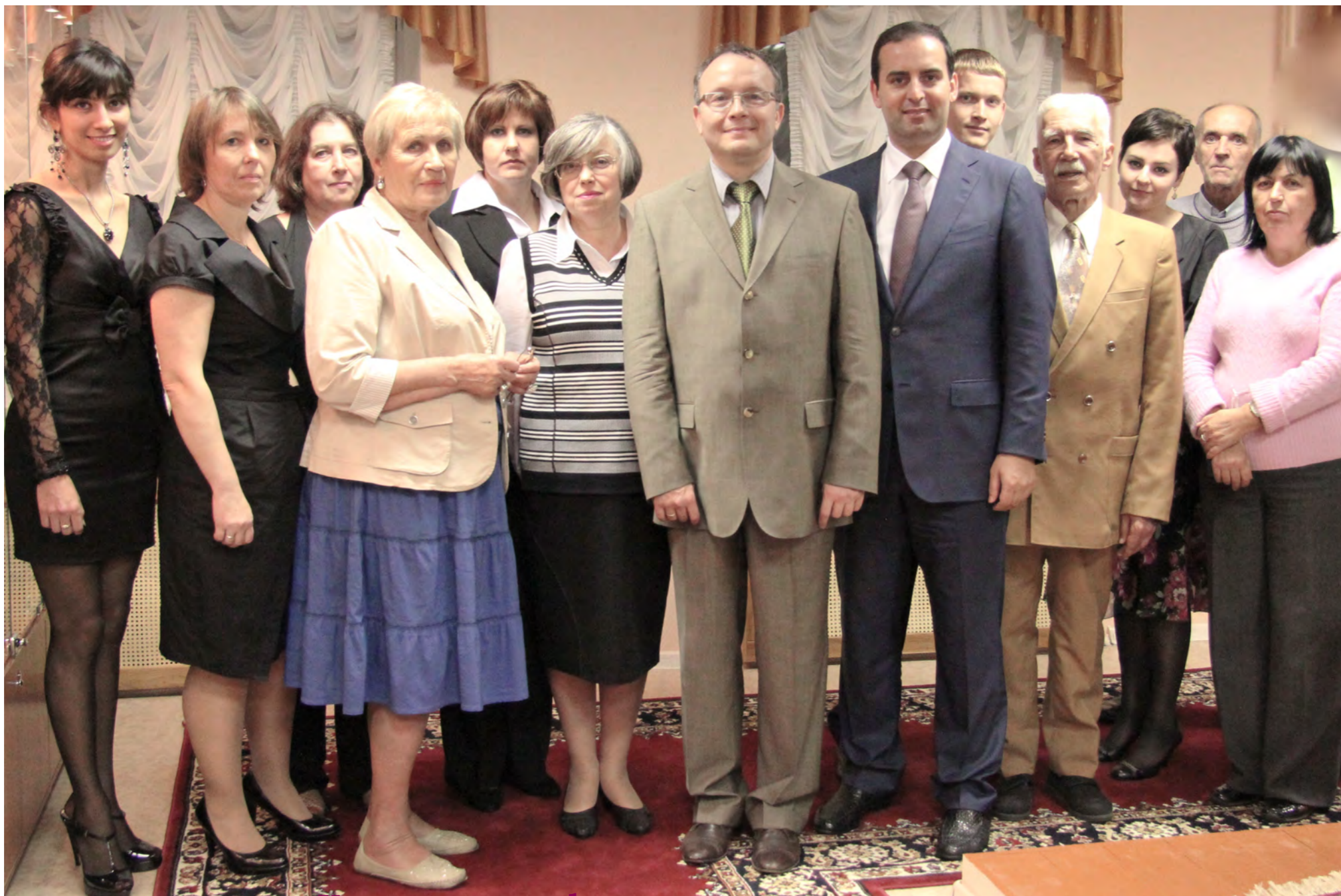
Коллектив кафедры истории медицины