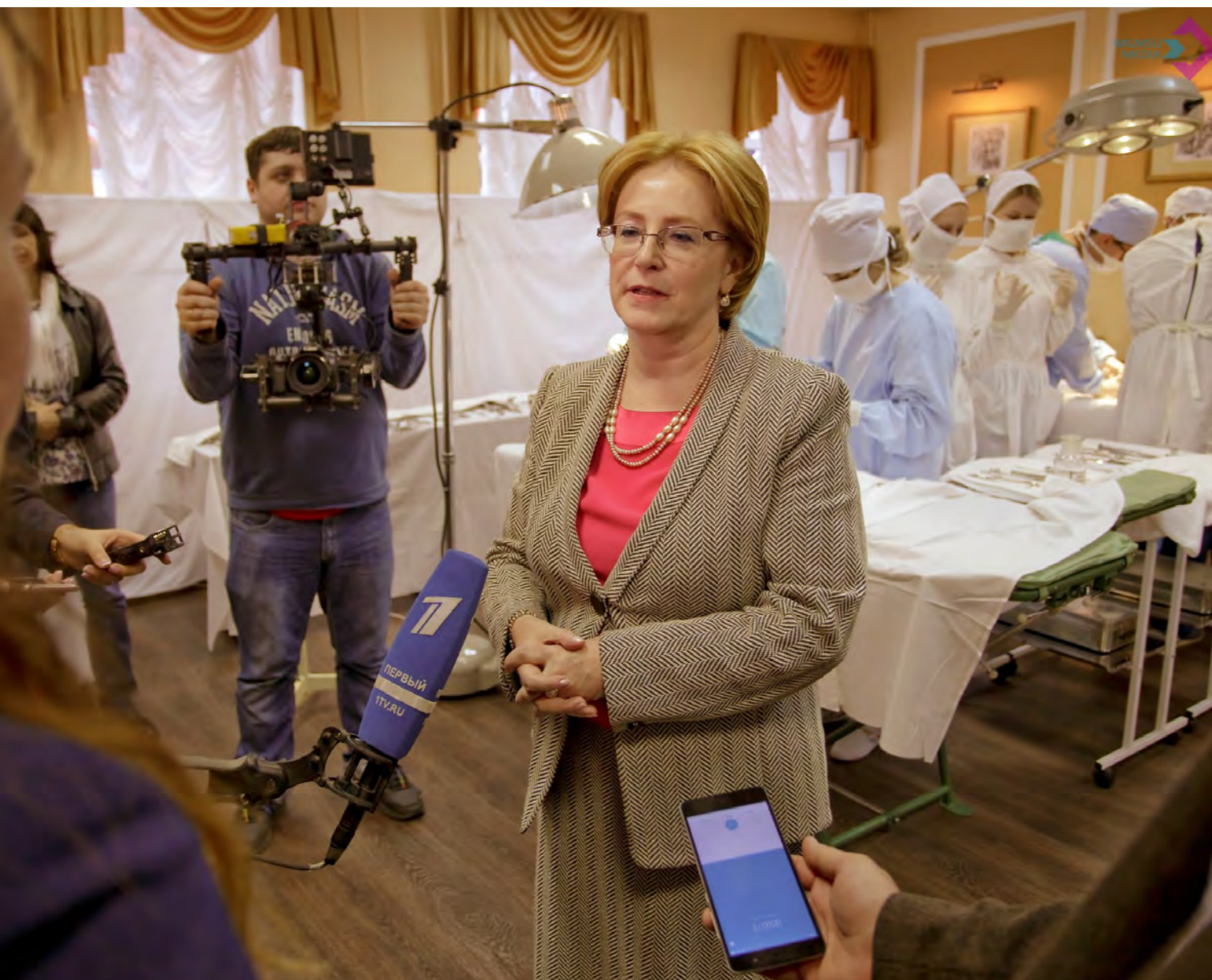
В 2017 году Музей посетила Министр здравоохранения РФ В.И. Скворцова

Музей постоянно открыт для посетителей и ежегодно в нем бывает более 5 тысяч человек, но самый интересный день – это, безусловно, «Ночь музеев»