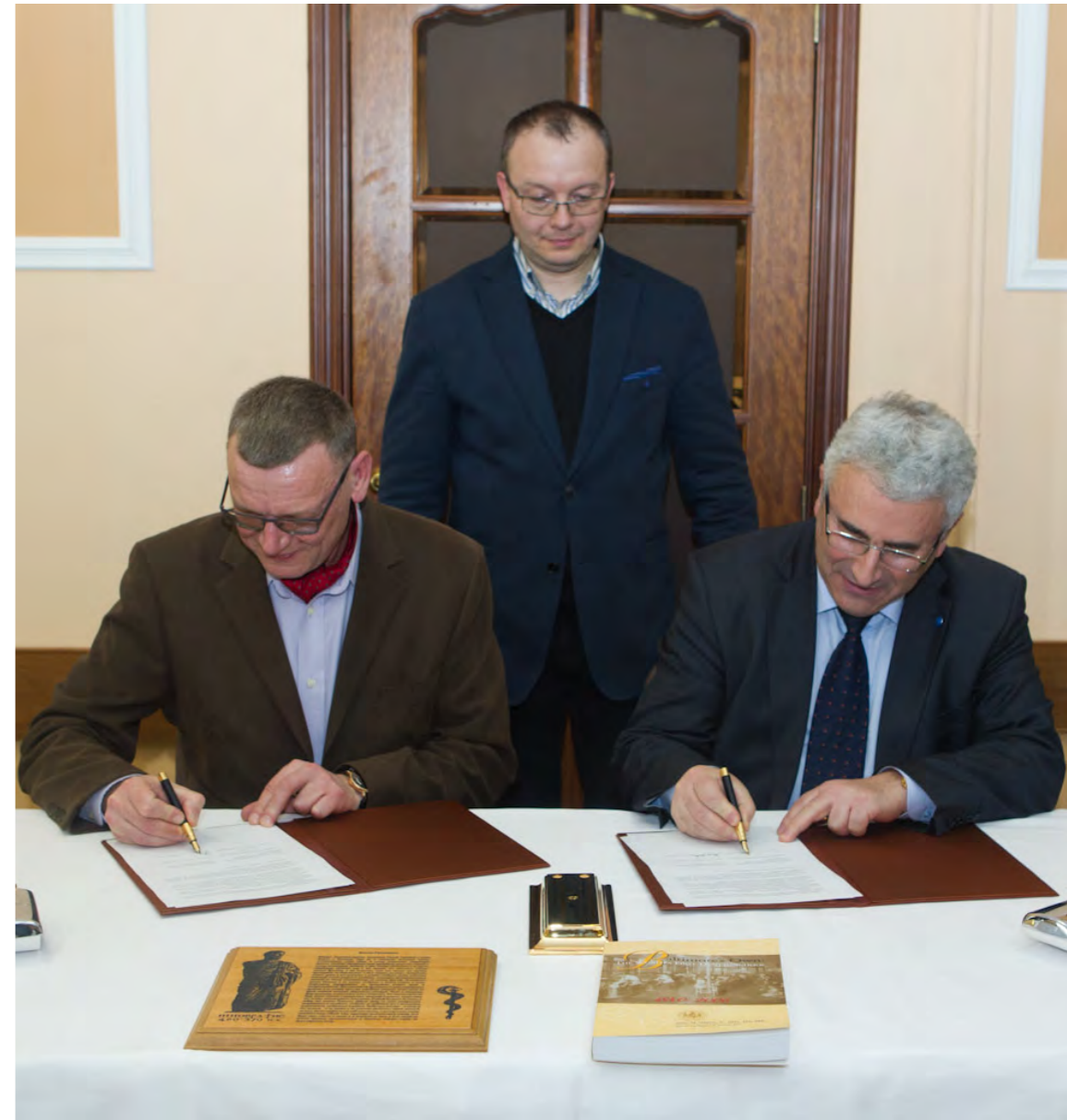
Подписание соглашения о сотрудничестве с Музеем медицины им. Пауля Страдыня (Рига, Латвия)

Зарегистрирован во Всероссийском реестре музеев