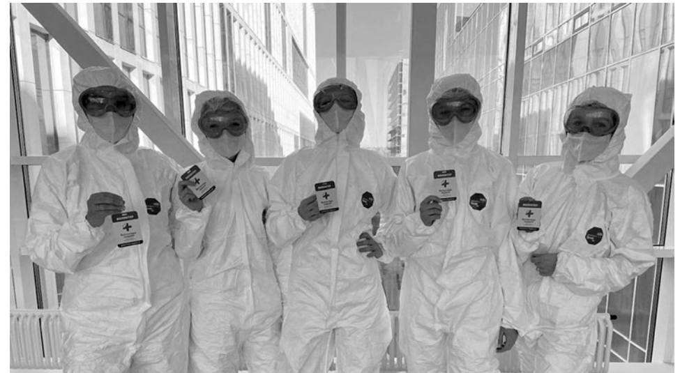
Рис. 2. Студенты-волонтеры Медицинского института РУДН в одной из клиник г. Москвы во время пандемии Covid-19. Весна 2020 г.

В 2020 г. в период первой волны пандемии коронавируса 347 студентов-волонтеров, 102 ординатора и 8 аспирантов РУДН добровольно принимали участие в лечебном процессе в специализированных инфекционных отделениях московских медицинских учреждений (рис. 2).