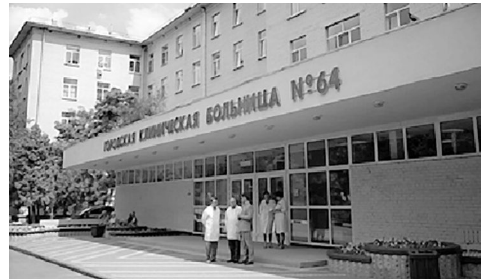
Рис. 6. Главный корпус Городской клинической больницы им. В.В. Виноградова

В наши дни в ГКБ им. В.В. Виноградова трудится большинство ординаторов и аспирантов кафедры. Весь лечебный и учебный процесс осуществляется в тесной связи с сотрудниками больницы: врачами, заведующими отделениями, медицинскими сестрами. Многие сотрудники больницы совмещают свою основную работу с преподавательской и научной деятельностью на кафедре.