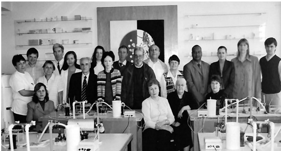
Рис. 8. Коллектив кафедры микробиологии. 2006 г.