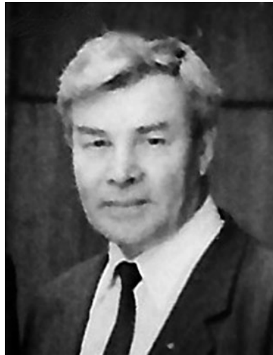
Рис. 2. Георгий Иванович Ежов

В начале 1970-х годов, в связи со строительством нового корпуса для Медицинского факультета УДН, кафедра переехала на ул. Миклухо-Маклая, дом 8. Здесь, на 3 этаже уже Медицинского института (МИ), а не факультета, кафедра располагается и по сей день.