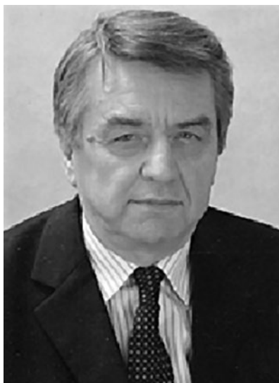
Рис. 4. Валентин Сергеевич Моисеев

В 1983 г. кафедру возглавил академик РАН, заслуженный деятель науки РФ Валентин Сергеевич Моисеев (рис. 4). Будучи одним из наиболее ярких представителей школы Е.М. Тареева, он нашел себя не только в практической, но в научной и педагогической деятельности.