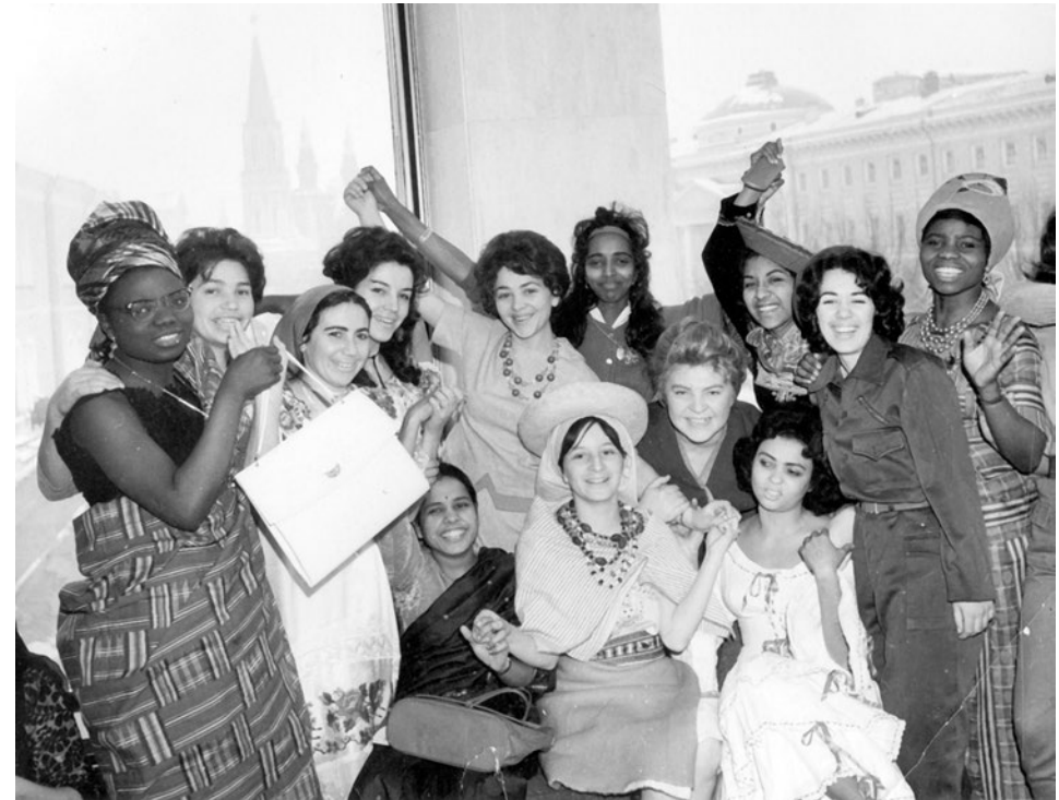
Рис. 1. Первые выпускники медицинского факультета УДН на Торжественном вечере в Кремлевском дворце съездов, посвященном первому выпуску врачей. Июнь 1966 г.

В наши дни Университет приглашает на обучение студентов ближнего и дальнего зарубежья и различных регионов России.