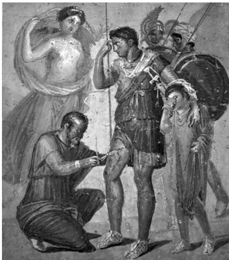
Япиг лечит Энея. Фреска. I век н. э. 45x48. Национальный археологический музей, Неаполь

В поиске тем для своих интерьеров римские заказчики обращались к эпизодам из римской литературы и истории (Радочицкая 2019: 57). На одной из картин воспроизведен эпизод из XII книги «Энеиды» Вергилия (ст. 384–424).