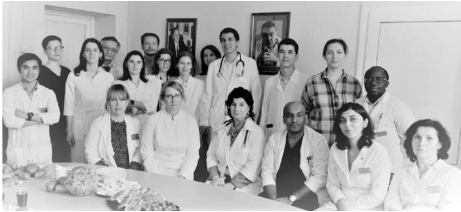
Рис. 7. Преподаватели кафедры, студенты, аспиранты и ординаторы на обсуждении результатов клинического обхода